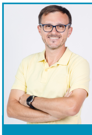
Martin Vdovičik fotograf kameraman